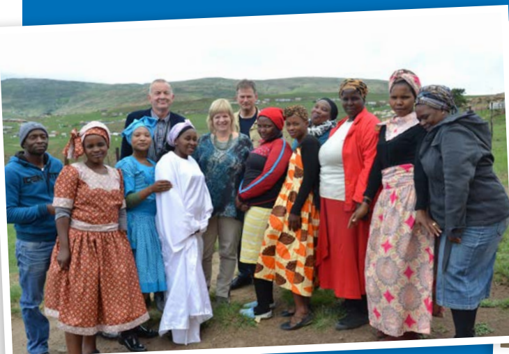
ediPhini naaigroep poseert met de delegatie van Sizanani. De schortjurken zijn zelfgemaakt.

De meeste leerlingen in de geletterdheidsklassen zijn teruggekomen dit jaar en hier en daar hebben we ook nieuwe leerlingen. Dit zorgt voor verschillende niveaus in de klas, wat een uitdaging is voor degene die les geeft. Een oplossing is dat leerlingen in groepen worden verdeeld en dat werkt goed. Ook kunnen de betere leerlingen soms de anderen helpen. Voor velen blijft rekenen een moeilijk vak. Vooral als men op een hoger niveau komt, klinken er stemmen dat ze nu wel genoeg weten. Bij opfrissingsdagen worden de mensen die les geven zelf weer gemotiveerd, bijvoorbeeld door methodes te bespreken om breuken uit te leggen.