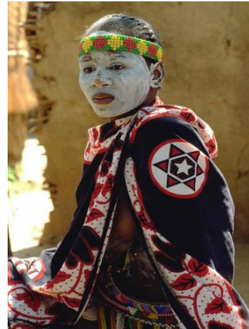
Sangoma: een traditionele dokter

Mooie dingen zijn er ook. Zoals de jongeman, die door een thuiszorgster verzorgd werd, en zich heeft laten testen op HIV omdat hij zo ziek was. Hij gebruikt nu al geruime tijd medicijnen en is zover opgeknapt dat hij weer kan werken en geld verdienen. Of de jonge vrouw die uiteindelijk aan haar familie heeft verteld dat ze HIV+ is en medicijnen gebruikt. Een Sizanani thuiszorgster heeft haar begeleid en de familie onderwezen. Tot vreugde van deze vrouw verwierp haar familie haar niet.