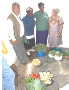
Oogst van 2010

Zes en dertig vrijwilligers zijn betrokken bij dit laatste, unieke project. Maar er blijft steeds de noodzaak opvolgers te vinden.