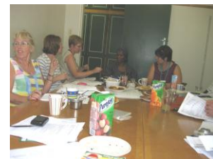
een vergadering van SET

We konden weer aan 34 leerlingen een Engelse cursus gecombineerd met een Life Skills cursus van 10 dagen laten aanbieden. We gebruiken daarbij hulpkrachten die bij SISA werken. We proberen elke cursus zoveel mogelijk met dezelfde kinderen te werken en een paar nieuwe modules te gebruiken, zodat er ook verbetering is en we de resultaten kunnen meten. De Life Skills cursus is enorm belangrijk, want daar leren de kinderen om keuzes te maken en groepsdruk te hanteren. Voor hen is het een levensveranderende cursus. Er is al een voorstel gedaan om jaarlijks een tweede engelse week in te stellen, maar de kosten van deze cursussen zijn erg hoog, en het is nog maar de vraag of we het kunnen volhouden om met de eerste week door te gaan. Als het met steun van de donateurs zal lukken, zou dat geweldig zijn.