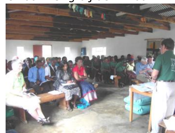
jaarvergadering van Sizanani S.A.

En jawel, om de winnaar uit te kiezen waren er dit jaar gelukkig mensen uit Nederland die dit mooi konden doen. U begrijpt, we hebben het moeilijk gehad.